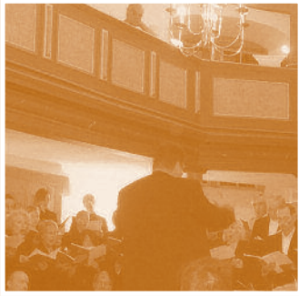
Rückblick: Das Rutter-Requiem in der Thalkirche | Seite 4