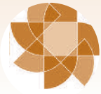
Der neue Pfarrgemeinderat ist gewählt | Seite 10

Der aktuelle Gemeindebrief auch im Internet zum Download: www.thalkirchengemeinde.de www.herz-jesu-sonnenberg.de