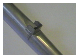
Pfeifen des Salicional 8' mit sog. Kastenbärten